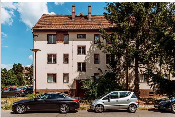
Gallinchener Straße 11-12

Vermietbare Fläche: 3.500,00 m 2 Kaufpreis: 3.000.000,00 EUR